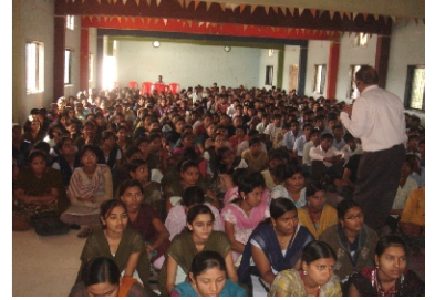
मार्गदर्शन सेमिनारला विद्यार्थ्यांचा लाभलेला उत्स्फूर्त प्रतिसाद