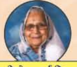
मातोश्री श्रीमती प्रेगाबाई भिकमवंदजी जैन उच्च शिक्षण शिष्यवृत्ती योजना

Suresh Dada Scheme for Educational & Entrepreneurial Development सुरेशदादा शैक्षणिक व उद्योजक विकास योजना