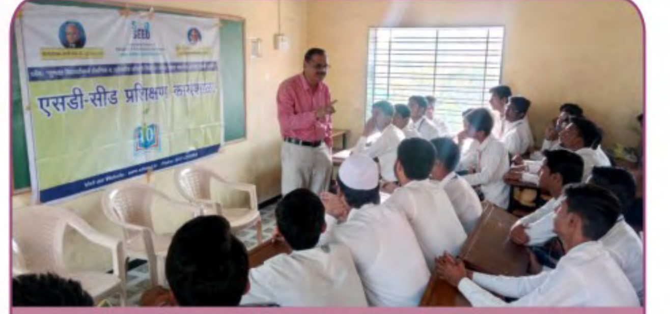
सीईटी परीक्षेची तयारी